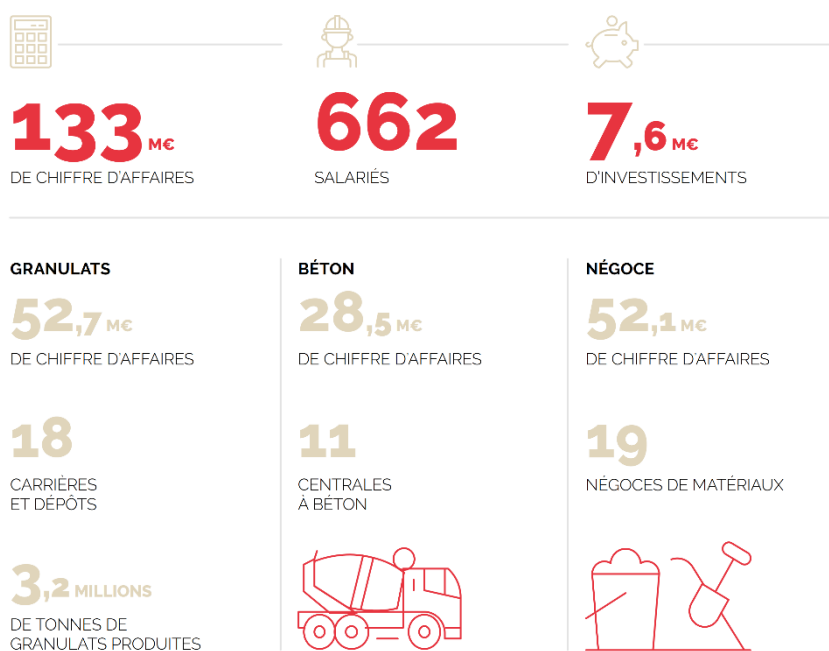
Figure 29. Chiffres clé du groupe Garandeau (source : Bilan RSE 2017-2020)