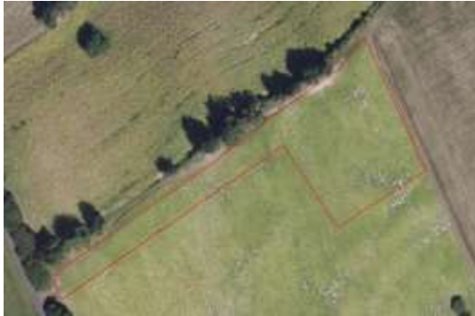
La parcelle de SNE cultivable. Elle reste en l'état.