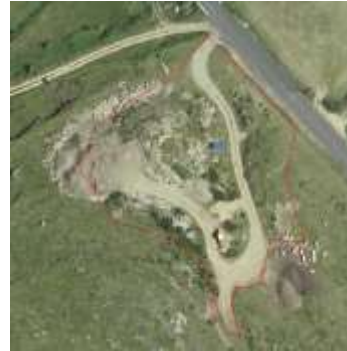
Zone de stockage non construite. Une SNA surface aménagée est saisie sur la SNE sans modifier l'îlot