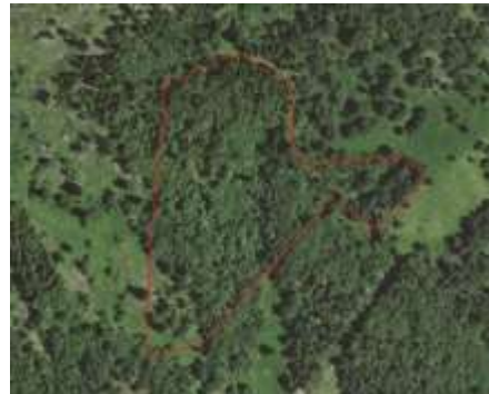
Parcelle recouverte de forêt hors zone de surfaces pastorales. Une SNA Forêt est saisie sans modifier l'îlot