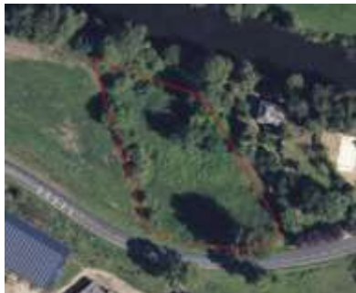
Numériser une SNA VNANC sur la SNE qui jouxte la prairie permanente sans modifier l'îlot