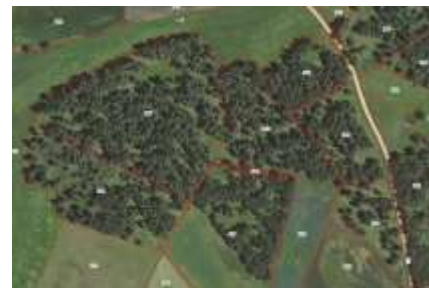
La végétation est clairsemée et ne peut pas être représentée par une SNA