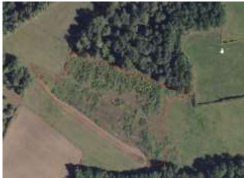
Une SNA VNANC est saisie sur une partie de la parcelle sans modifier l'îlot