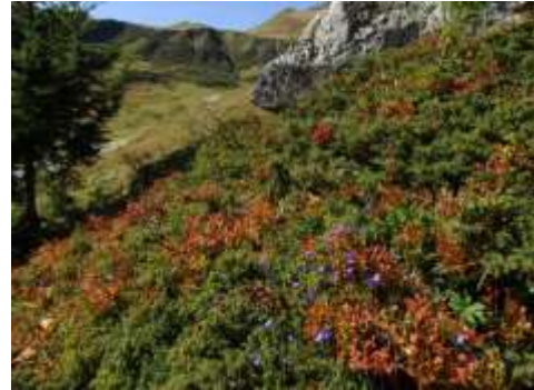
Broussaille sur le terrain