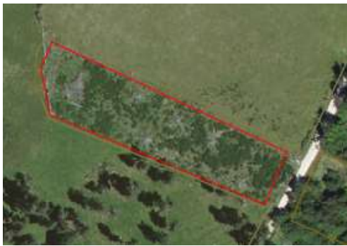
Broussaille diffuse non numérisée en SNA dans une parcelle de prairie permanente