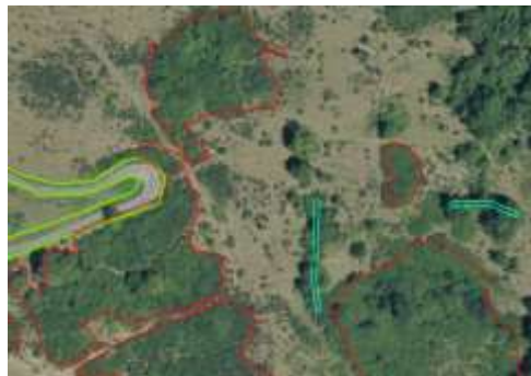
Végétation ligneuse impénétrable numérisée en broussaille