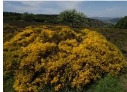
Autre exemple de broussaille sur le terrain