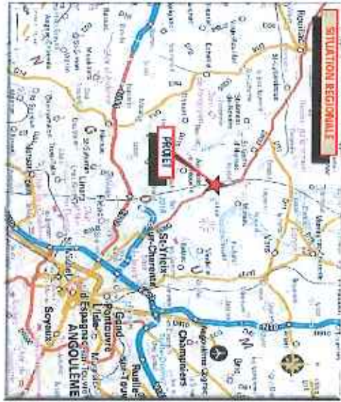
Figure 03 Plan de situation au 1/25 000