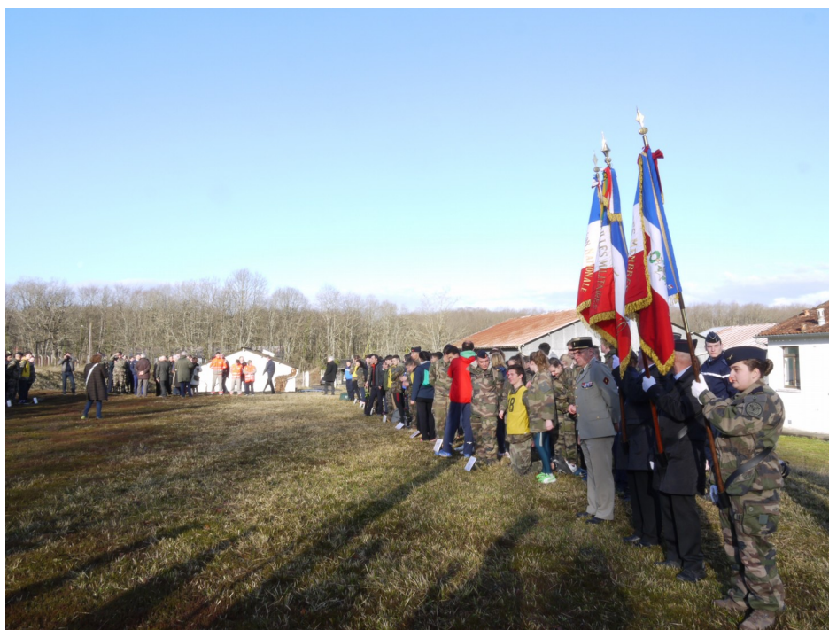
@DMD de la Charente - Rallye citoyen 2018

Secrétariat : nathalie.ramounet@intradef.gouv.fr / 05.45.22.86.76