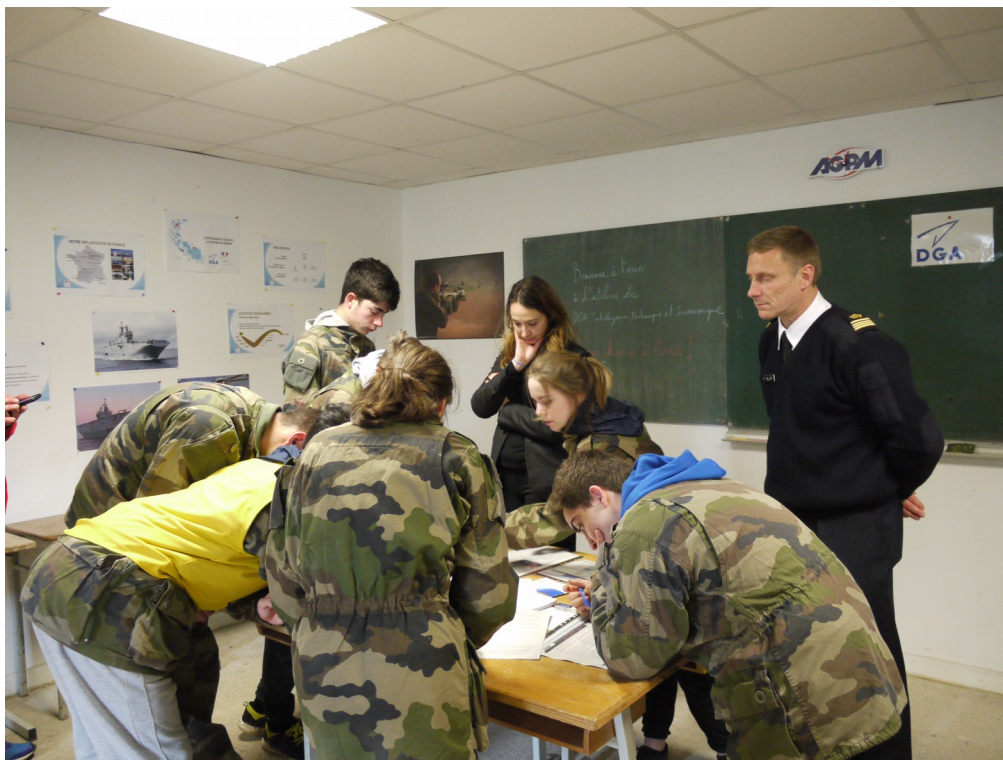
Rallye citoyen 2018