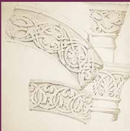
Carnet Abadie

Les visites de l'hôtel de la Préfecture (19 ou 20 avril) sont limitées à 30 personnes et réservées prioritairement aux personnes inscrites à l'ensemble des conférences. Inscription OBLIGATOIRE au plus tard la veille avant 16h auprès de Via patrimoine.