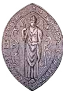
Sceau de l’abbé de Saint-Amant de Boixe in BMSAHC 1878-79