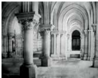
L’hôtel de ville d’Angoulême

11h15 - 12h15 : « Monuments et pouvoirs, au prisme de l’archive photographique (1851 – 1905) » par Jean-Michel FAURE