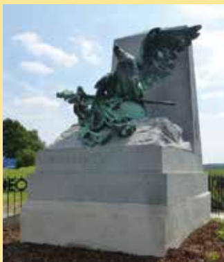
« L'aigle blessé » Waterloo

par Stéphane CALVET, Professeur d'histoire & géographie au lycée Guez de Balzac à Angoulême, chargé de conférences à l'IEP de Poitiers, Docteur en Histoire contemporaine et spécialiste des questions militaires.