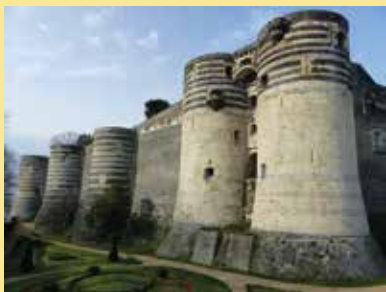
Le château d'Angers

11h15 - 12h15 : « Le château est-il un monument politique ? »